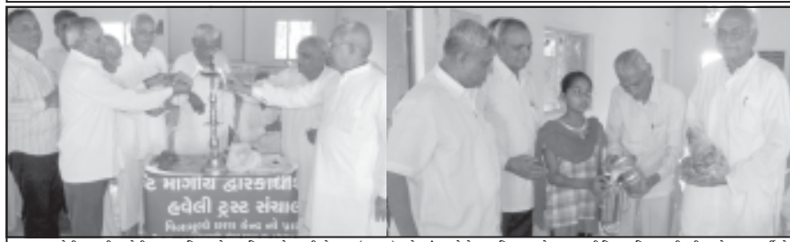
અમરેલી દ્વારકાધીશ હવેલી ટ્રસ્ટ દ્વારા વિનામૂલ્યે છાસ વિતરણનો ગાયત્રી મોહધામ (સ્થાન) ખાતે પ્રારંભ થયો છે. છાસ વિતરણ સાથે શાકભાજીની કિંમત પણ વિતરણ કરી હતી. વધુને વધુ લાભાર્થીઓ લાભ લે તેવી આશીર્વાદો આપી છે. તે વખતે આ સંસ્થામાં અગ્રણીઓ જરૂર પડે છે.

અમરેલી દ્વારકાધીશ હવેલી ટ્રસ્ટ દ્વારા ઉનાળાનાં કાળગળ ગરમીનાં દિવસોમાં સેવાકીય આયોજન