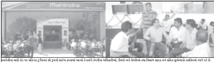
अमरेलीना वाही रोड पर महिन्द्रा टू डिव्यर शो रुमनो प्रारंभ करवानां आनो ते प्रसंगे कंपनीना अधिष्ठात्रीओ, डीकेओ अने देपटीओ तथा विशाण शाहक वगं सभित शुभेच्छो तसविबरमां नजरें परें छे.