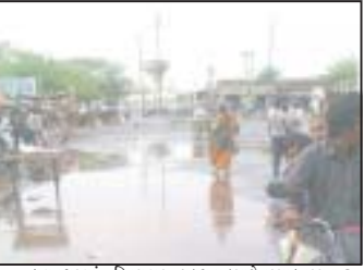
દામનગરમાં દિવસભર પલટાના કરાથે વરસાદ વરસતા ૩૦ અસહ્ય અંગ દરાસતિ બુ અને ગરમી મીનીટ સુધીમાં માર્ગો ભીના થયા વચ્ચે સમીસાંજે પાંચ કલાકે વાતાવરણ હતા અને હેડક પ્રસરી હતી.

અમરેલી, અમરેલી જિલ્લામાં ૪૪ ડીગ્રી પ્રમાણ વધતા બકરા સાથે કાળઝાળ અંગ દરાસની ગરમી પડયા દામનગરમાં કરા સાથે વરસાદ બાદ બે દિવસમાં ગરમીમાં મહદ વરસ્યો હતો.