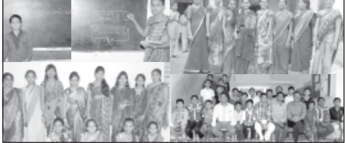
લીલીયા (મહેસાણા) શ્રી મહાદેવની કન્યા વિદ્યાલય તરફથી આયોજાયેલા કાર્યક્રમોમાં વિદ્યાર્થીઓએ સ્વયંશિક્ષકની ભૂમિકા નિભાવી હતી.

વિદ્યાર્થીઓએ સ્વયંશિક્ષકની ભૂમિકા નિભાવી : સ્ટાફ દ્વારા માર્ગદર્શન અને નિરિક્ષણ