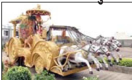
रामकृष्ण ट्रस्ट राजकोट द्वारा निकाले श्री स्वामी विवेकानंद रथ यात्रा अमरेलीमां आवी पधोचता पाठक स्कुल भावे स्वागत करवामां आयु हुत ते वेवाणे रथ तसवीरमां नजरे पडे छे.