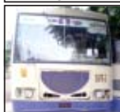
अमरेली, अमरेली शहर पोलीस द्वारा शहरमां ट्राफिक समस्या उब करवा याली रडेली जुंभेशने शहरभरमांथी भारे आवकार सांपदी रहयो छे आजे राजकमल चोक विस्तारमां ट्राफिक जाम करनार असे.टी.भसने मुसाइरो साथे

राजकमल चोकमांथी मुसाइरो भरेल असे.टी.भस पोलीस स्टेशन लावता मुसाइरोना जुव उचक : अंते दंड वसुली भसने रवाना कराइ