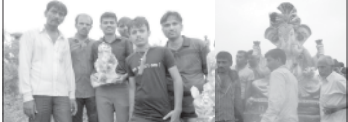
બાબરા, (દેશક ક્રમ) ધામધુમ સાથે ગણપતિની આરાધના કરવામાં આવી હતી. આ પ્રસંગે રોજ રાસ ગરબા અને સાંસ્કૃતિક કાર્યક્રમ રજૂ કરવામાં આવેલ હતા.

રામપરા મંડળ ખાતે ગણપતિભાષાને વાજતે ગાજતે વિદાય અપાઈ : ભાવિકો ઉમટયા