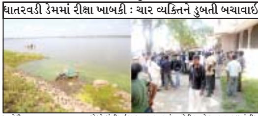
અમરેલી, રાજુલા શહેરના બાયપાસના વહેલી સવારે રીક્ષા પટ્ટી ખાઈ જતા ધાતરવડી ડેમમાં ખાબકી ગયા વ્યક્તિને ડુબતી બચાવ્યાઈ