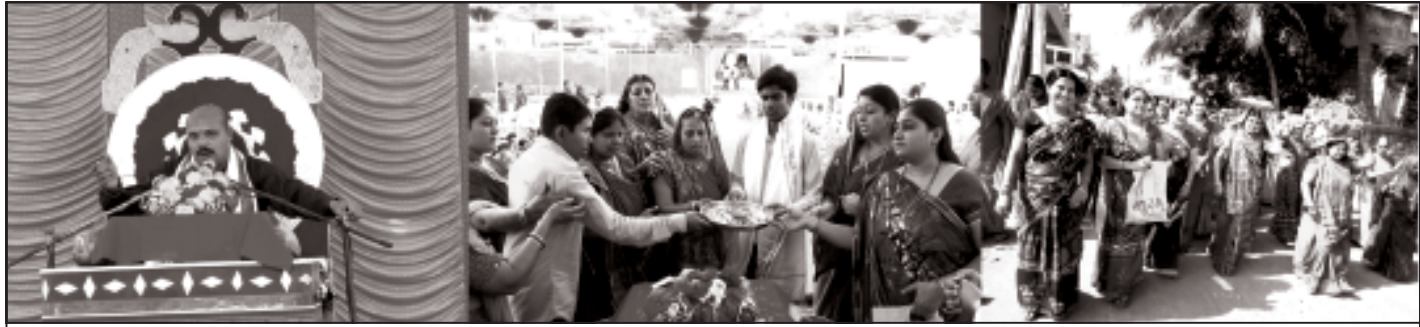
રાજુલા શહેરમાં જોષી પરિવાર દ્વારા શ્રીમદ્ ભાગવત જ્ઞાનયજ્ઞનું આયોજન થતા પોથી યાત્રા સાથે પ્રારંભ થયો હતો. ભવ્ય પોથીયાત્રામાં વિશાળ સંખ્યામાં પરિવારજનો તથા ધાર્મિક જનતા જોડાઈ તે પ્રસંગી તસવીરમાં નજર પડે છે.