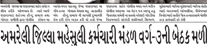
અમરેલી જિલ્લા માહેસુલી કર્મચારી મંડળ વર્ગ-૩ની બેઠક મળી

અમરેલી, અમરેલી જિલ્લા માહેસુલી કર્મચારી મંડળ વર્ગ-૩ની બેઠક મળી