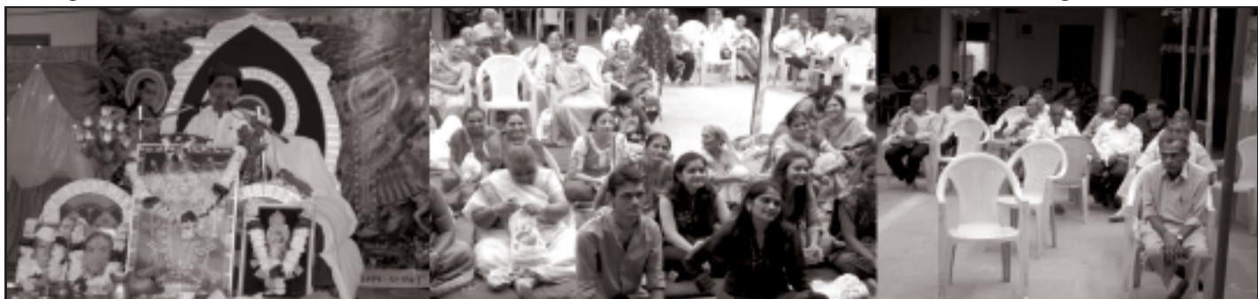
રાજુલા ખાતે મહેતા પરિવાર દ્વારા આશ્વમેધ શ્રીમદ્ ભાગવત જ્ઞાનયજ્ઞનું આયોજન કરવામાં આવ્યું તે પ્રસંગે કથા વાંચ કરી રહેલા શાસ્ત્રીશ્રી અને કથા શ્રવણ માટે ઉમટી પડેલ જનમેદની તથા મહેતા પરિવાર સહિત કથાનાં આયોજકો સેવાભાવીઓ તસવીરમાં નજર પડે છે.