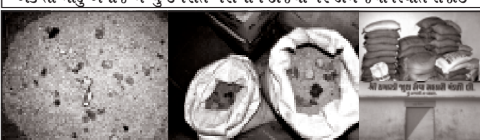
બાબરા, બાબરા તાલુકાના ચમારડી ગામે જુથ સેવા સહકારી મંડળી લી. મંડળી હસ્તક સસ્તા અનાજની દુકાન આરેલી છે જેમાં છેલ્લા પાંચ દિવસથી

એક તો મોડુ અનાજ મળ્યું ઉપરાંત ગરીબોને દાજ્યા પર ડામ જેવી સ્થિતિ સર્જાઈ