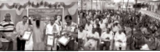
શાંતિ અગ્રણીઓએ જહેમત ઉઠાવી હતી.