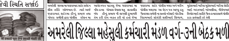
અમરેલી જિલ્લા માહેસુલી કર્મચારી મંડળ વર્ગ-૩ની બેઠક મળી

અમરેલી, અમરેલી જિલ્લા માહેસુલી કર્મચારી મંડળ વર્ગ-૩ના કર્મચારીઓ પ્રને મુરકેલી નિવારણ રજુઆત કરેલી છે. અમરેલી જિલ્લા માહેસુલી કર્મચારી મંડળ વર્ગ-૩ના કર્મચારીઓ પ્રને મુરકેલી નિવારણ રજુઆત કરેલી છે. અમરેલી જિલ્લા માહેસુલી કર્મચારી મંડળ વર્ગ-૩ના કર્મચારીઓ પ્રને મુરકેલી નિવારણ રજુઆત કરેલી છે. અમરેલી જિલ્લા માહેસુલી કર્મચારી મંડળ વર્ગ-૩ના કર્મચારીઓ પ્રને મુરકેલી નિવારણ રજુઆત કરેલી છે.