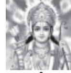
જય શ્રી રામ

લોહાણા મહાજન વાડીના લોકાર્પણ પ્રસંગે સુમધુરચાદ સ્વરૂપે