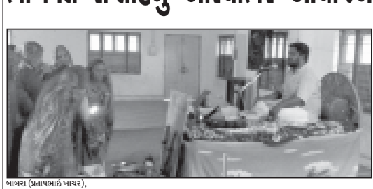
બાબરા (પ્રતાપખાતર ખાતર) બાબરામાં રાજગોર બ્રાહ્મણ સેવા સહિત દ્વારા પવિત્ર પુરુષોત્તમ માસમાં રાજગોર બ્રાહ્મણ શાસ્ત્રી વાદી ખાતે તા. ૧૬ જુલાઈ સુધી શ્રીમદ ભાગવત સપ્તાહનું આયોજન કરવામાં આવેલ છે. વ્યાસપીઠ પર શાસ્ત્રી જુનાબાદ ખાબરીયાવાળા બિરાજ સંગીતમય શૈલીમાં કથાનું સંસ્થાન કરાવી રહ્યા છે.

અમરેલી જિલ્લામાં સગીરાઓને ભોળવી ઉઠાવી જવાના બનાવોમાં વધારો : વાલીઓ ચિંતાતુર