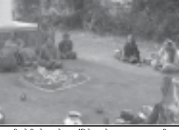
નામુઝીમાં ગોર પુજન કરતી ગોપીઓ મહાદેવના મંદિરે પુરુષોત્તમ માસ પુજન કરતી નજરે પડે છે.