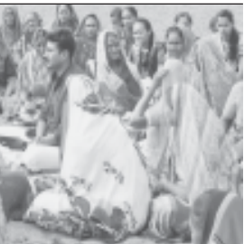
ધારગણીમાં તેલ નટીના કાંડે અધિક પુરુષોત્તમ માસમાં પુજાઅર્ચન સહિત કાર્યક્રમ યોજાય છે અને તે દ્વારા કલકાવેરું પુજન કરવામાં આવે છે. ત્રાટ પુજા દાન થમં પણ કરે છે.