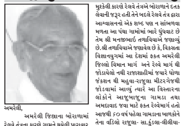
અમરેલી, અમરેલી જિલ્લાના બોરાળામાં રેલ્વે તંત્રના કારણે ગામને ચેલેલી પાચારવ

રોજના ચાર કરોડ કમાઇને આપતા રેલ્વે ટ્રેકનું ધોવાણ થતા કામ શરૂ થયું