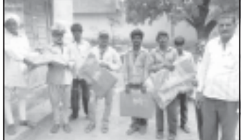
ચલાવા, પાણીયાદેવના ગુંપડા તણાઈ જતા તાલપત્રી વિતરણ કરવામાં આવી હતી. ધારી તાલુકાના પાણીયાદેવ ગામે

આગેવાનોના હસ્તે વિતરણ : અતિવૃષ્ટિથી ભારે નુકશાન